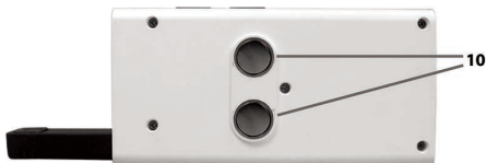
SUPERTOOTH LIGHT (Rückansicht)